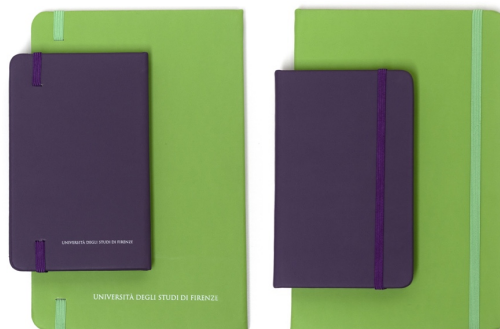
A6 (sotto) e A5 (sopra)

7.B.07 Quaderno in PU colori vari , formato A5 , elastico e segnalibro in tinta colore, personalizzato con logo (stampa a 1 colore), pagine interne bianche o avorioate (circa 90 pagina), carta da 100 gr, minimo 80 pagine vedi immagine del prodotto 6.B.06